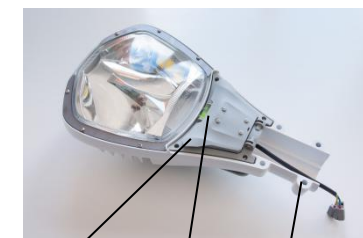
Рисунок 2. Схема установки светильника на кронштейн.